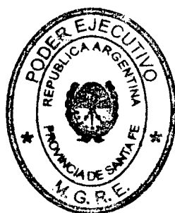
ROBERTO MIGUEL LIFSCHITZ GOBERNADOR DE SANTA FE